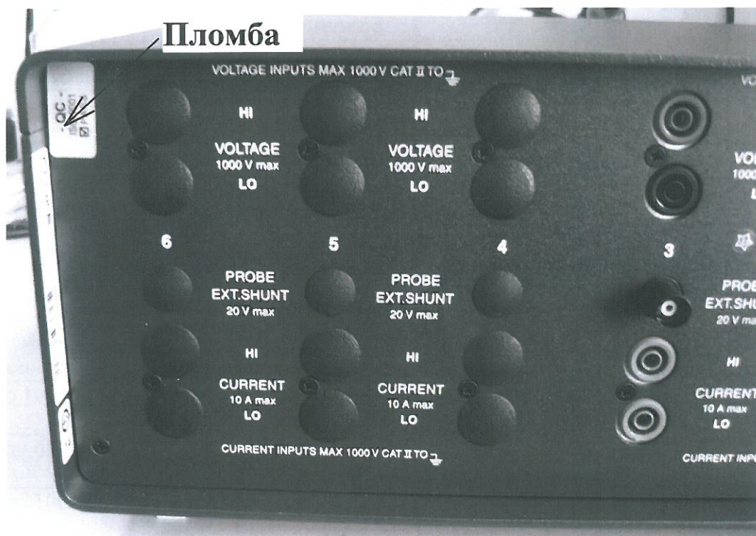
Рисунок 4. Схема пломбирования регистраторов модели Fluke Norma 5000.

Различие моделей регистраторов заключается в том, что в конструктивное исполнение регистраторов модели Fluke Norma 4000 могут входить до трёх фазовых модулей, а регистраторов модели Fluke Norma 5000 – до шести. Различие метрологических характеристик фазовых модулей приведено в таблицах 2-6.