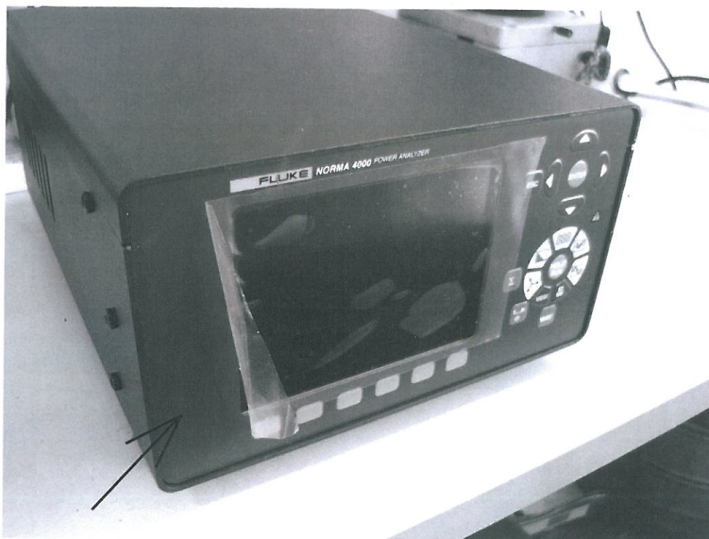
Рисунок 1. Внешний вид регистратора модели Fluke Norma 4000, стрелкой показано место нанесения знака утверждения типа.

В регистраторах предусмотрена возможность сохранения результатов измерения во внутренней энергонезависимой памяти с последующей загрузкой на ЭВМ.