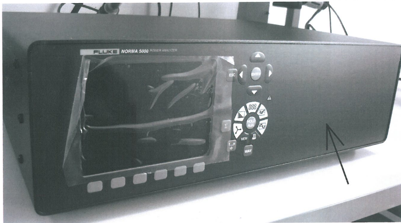
Рисунок 2. Внешний вид регистратора модели Fluke Norma 5000, стрелкой показано место нанесения знака утверждения типа.

Связь регистраторов с ЭВМ осуществляется с помощью набора цифровых интерфейсов.